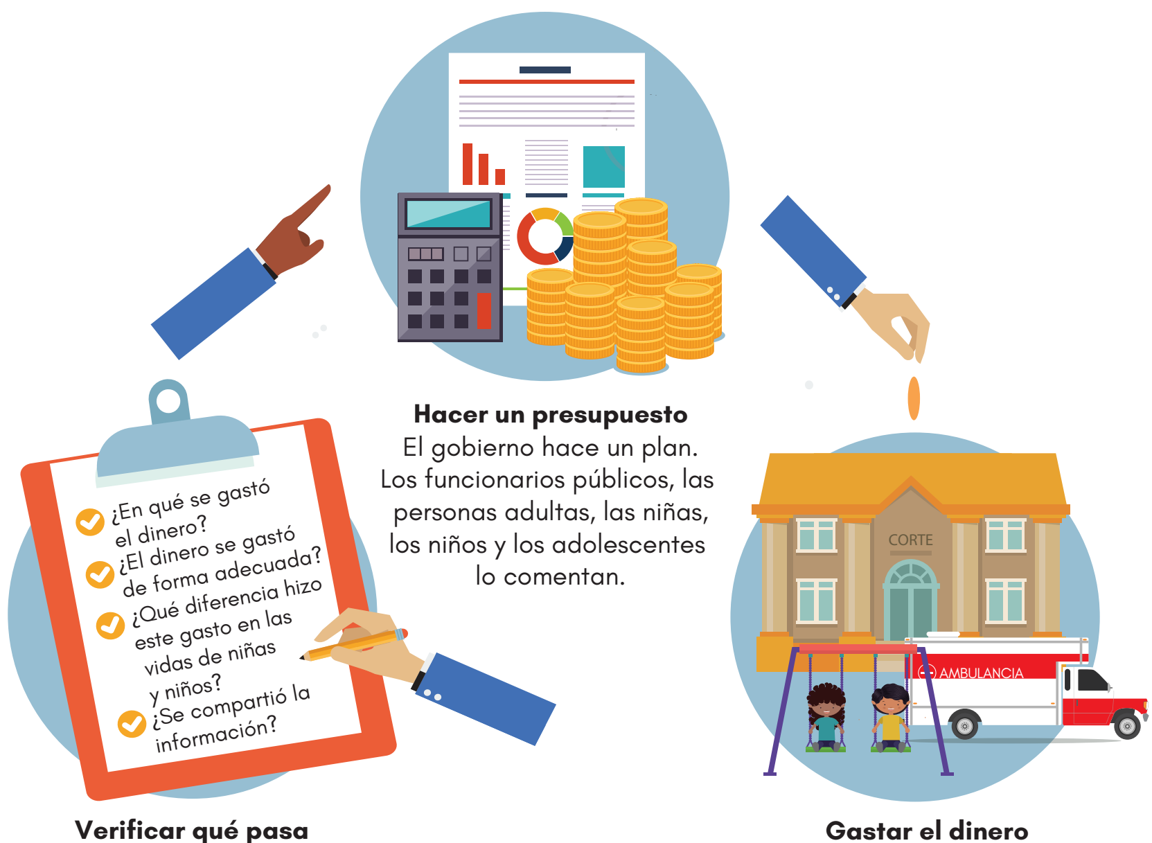
Verificar qué pasa